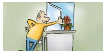
Luk for radiatorens termostat, mens du lufter ud.