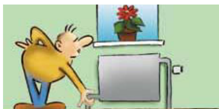
Kontroller, at radiatoren er kold eller højst lukken i bunden.