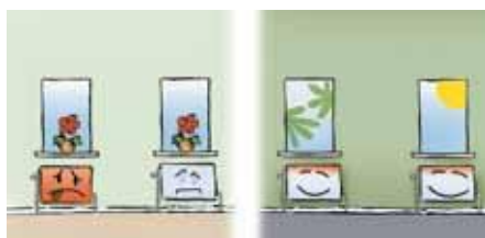
Brug alle radiatorer i samme rum og indstil dem ens.

Hvis man allerede bruger varmen fornuftigt, kan det være varmeanlægget, der skal justeres eller forbedres. Se bagsiden.